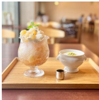
「特製ヨーグルトクリームと食べる桃のかき氷」（イメージ）