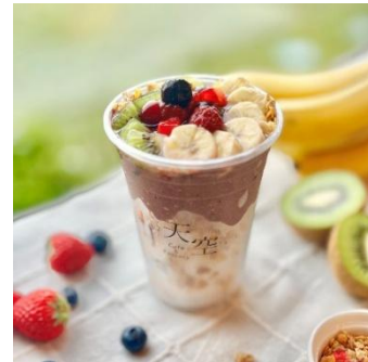
「アサイーIce」 （イメージ）