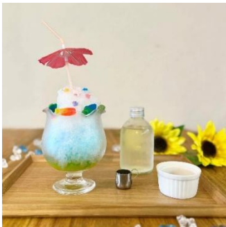
「ドリンコリ Blue なレモンスカッシュ」 （イメージ）