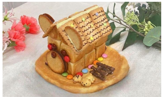
「パンデコハウス」（イメージ）

パンデコとは、本物のパン生地を使用した食べられるパンの作品です。実際にパン生地で作ったパンデコをお作りいただき、パンとクリーム、お菓子を組合わせて世界にひとつだけの「パンデコハウス」をお作りいただきます。