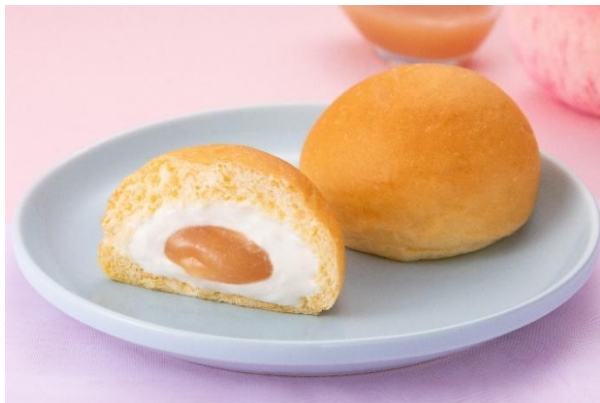
「冷やして食べる とろけるミルクくりーむパン 福島県産もも」 (イメージ)

あっさりとした味わいのミルククリームと優しい甘さのももフィリングが合わさり芳醇な香りが広がる、これからの暑い時期にぴったりな限定商品です。