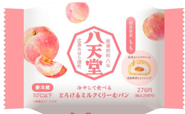
「パッケージ」(イメージ)