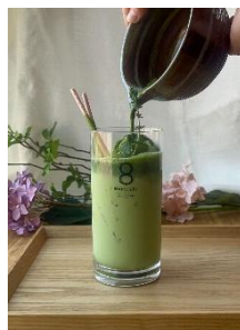
「お抹茶みるくらテ」 （イメージ）