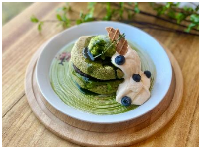
「グリーン香る抹茶のぱんケーキ」 （イメージ）

ふんわりとしてなめらかなちどけの抹茶風味のホイップクリームを乗せたフローズラテです。まるで雲のような、ふわふわでとろとろの舌触りが新しい限定ドリンクメニューです。ドリンクの底に入れたあんこと一緒に混ぜてお召し上がりください。