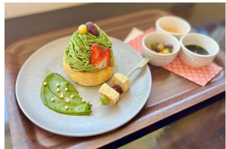
「和フレンチモンブラン ～濃厚抹茶クリームを添えて～」 （イメージ）