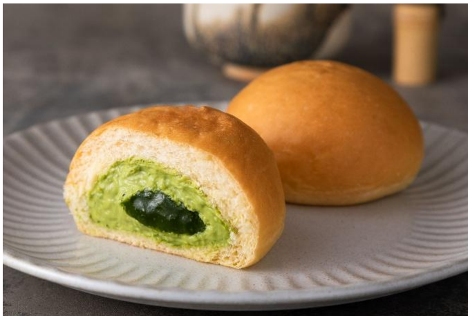
「冷やして食べる とろけるくりーむパン 出雲抹茶」 (イメージ)

芳醇な抹茶クリームと中心の濃厚な抹茶ソースは、食べ進めていくにつれ抹茶の味わいの変化をお楽しみいただけます。