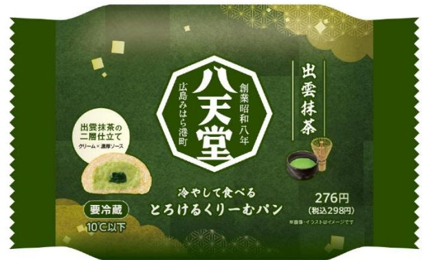
「パッケージ」(イメージ)