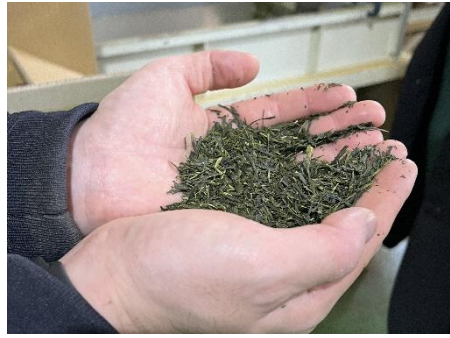
「出雲抹茶 製造過程の様子」(イメージ)