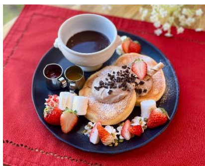
「贅沢いちごのチョコフォンデュぱんケーキ」 （イメージ）

いちごで出来た、目にも華やかなブーケです。そのままはもちろん、お好みで生クリーム＆カスタードクリームとチョコレートクリームをディップして、クリームといちごの甘酸っぱい味わいをご堪能ください。