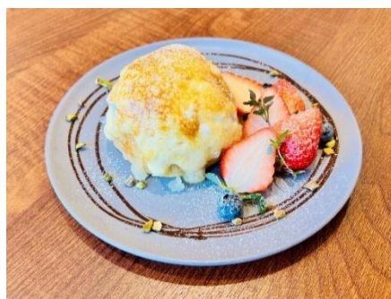
「いちごとチョコの天空ブリュレ」 （イメージ）