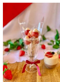
「苺ブーケ」 （イメージ）