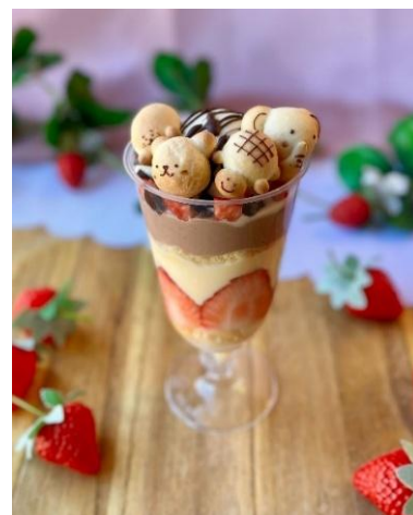
「いちごとチョコのパフェ作り体験」 （イメージ）

パフェの上にはご自身で好きな形に仕上げたパンを乗せて、さらに可愛く飾り付けが出来ます。ご自身でオリジナルのパフェが作れる体験プログラムです。