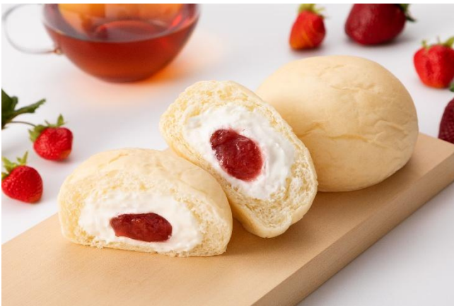
「冷やして食べる 白いくリーむパン 福岡あまおういちご」 （イメージ）