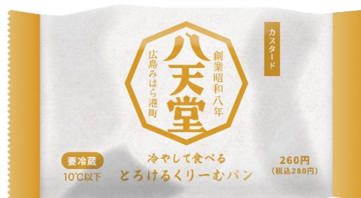
「冷やして食べる とろけるくリーむパン カスタード パッケージ」(イメージ)

「冷やして食べる 白いくリーむパン 福岡あまおういちご」と一緒にお楽しみください。