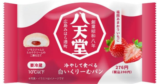
「パッケージ」（イメージ）