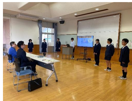
「プレゼン大会の様子」

プレゼン大会では、どの班も大きく分かりやすい身振り手振りと元気の良い挨拶で、小学生のパワーとエネルギーが溢れる、地域を元気にしたいという熱い思いが伝わる、素敵なプレゼンが行われました。