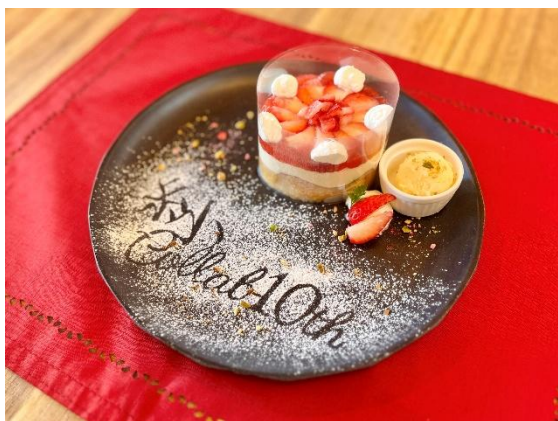
「苺のフレンチトースト」（イメージ）

八天堂は「パン」と「スイーツ」が融合した「スイーツパン」で、お客様の笑顔・働くことで輝く人・より豊かな社会を創造・貢献することを目指します。