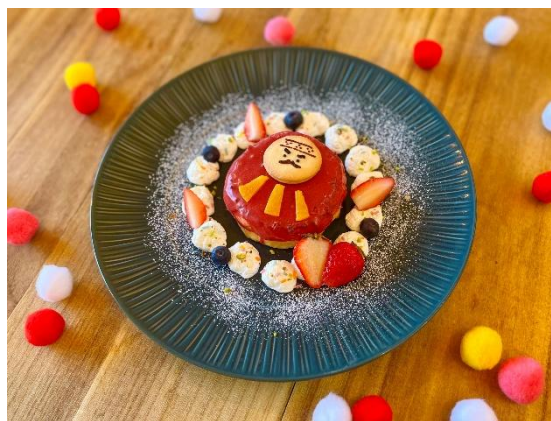
「三原だるまフレンチトースト」 （イメージ）