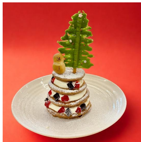
「オリジナルパンケーキツリー」（イメージ）

実際のパン生地を使ったアート作品『パンデコ』で、世界に一つだけのオーナメントをお作りいただきます。