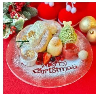
「ふわふわ雪のクリスマスぱんケーキ」 （イメージ）

ご注文を受けてから焼き上げるぱんケーキに、とろけるクリームとホワイトチョコレートをトッピング。クリスマスツリーを模した、クリームで出来たミニツリーと、優しい甘さのパン生地で出来た雪だるまもポイントです。甘酸っぱいいちごジャムをかけてお召し上がりください。