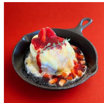
「ふわトロブリュレフレンチトースト」 （イメージ）

マシュマロを贅沢に使用した、寒い冬にぴったりなドリンクメニュー。ピスタチオがアクセントです。