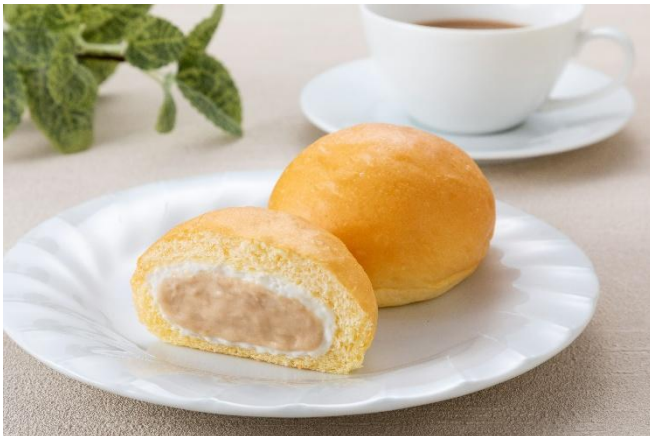
「冷やして食べる とろけるくりーむパン ミルクティー」 （イメージ）

これからの冬にほっと一息つける本商品は、ファミリーマート限定のフレーバーで販売します。