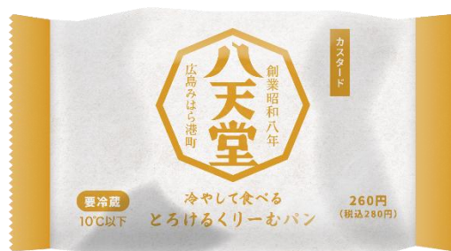
「冷やして食べる とろけるくりーむパン カスタード パッケージ」(イメージ)