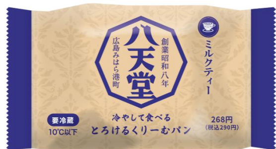
「パッケージ」（イメージ）