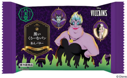
「パッケージ」（イメージ）