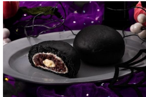
「黒いくリーむパン あんバター」（イメージ）