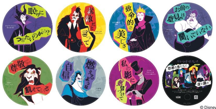
『パワーワード・ヴィランズ』キャンペーン 限定うちわ（イメージ）