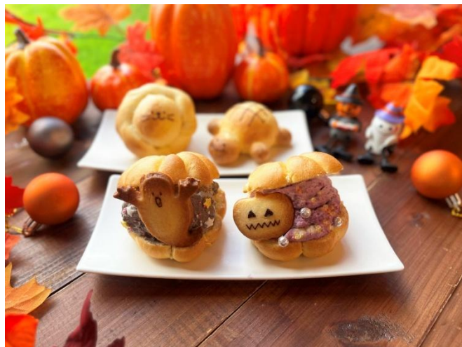
「ハロウィーン限定パン作り体験」（イメージ）