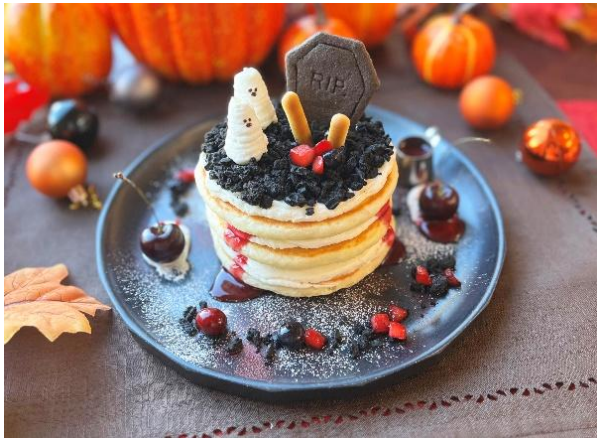
「みっけ！～おばけたちのかくれんぼぱんケーキ～」 （イメージ）

まるで魔女の鍋のように、ぐつぐつ泡立つぶどうソーダです。パチパチ弾ける食感と、ベリーやゼリーの甘酸っぱさを重ねた、目でも耳でも楽しめるドリンクメニューです。