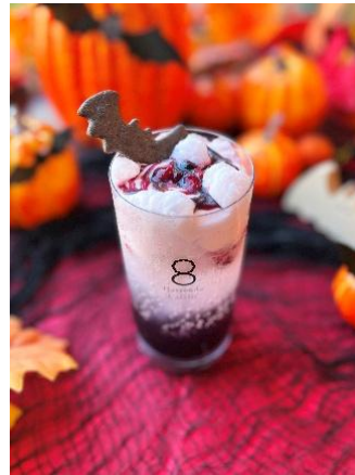
「ぐつぐつ魔女のぶどうソーダ」 （イメージ）