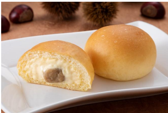
「冷やして食べる とろけるくりーむパン 和栗」 （イメージ）

ワンハンドで秋を感じられる「冷やして食べる とろけるくりーむパン 和栗」は、秋の散策のおやつにもぴったりです。