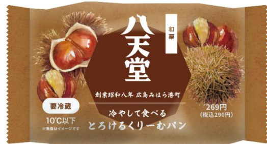
「パッケージ」（イメージ）