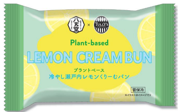
「パッケージ」(イメージ)