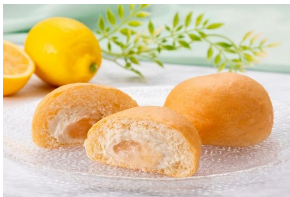
「八天堂×タリーズ プラントベース 冷やし瀬戸内レモンくりーむパン」(イメージ)

八天堂は「パン」と「スイーツ」が融合した「スイーツパン」で、お客様の笑顔・働くことで輝く人・より豊かな社会を創造・貢献することを目指します。