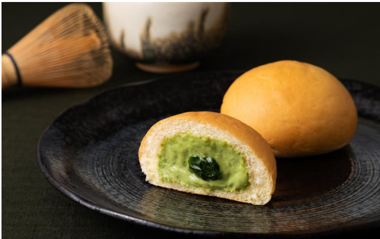
「冷やして食べる とろけるくりーむパン 出雲抹茶」(イメージ)

色鮮やかな見た目も美しい季節限定のフレーバーは、抹茶をデザインにあしらったグリーンのパッケージが目印です。