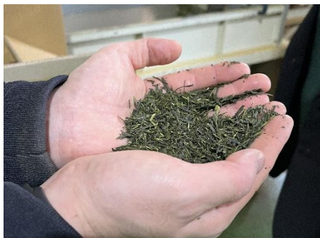
「出雲抹茶 製造過程の様子」(イメージ)