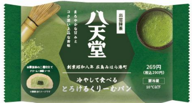
「パッケージ」(イメージ)