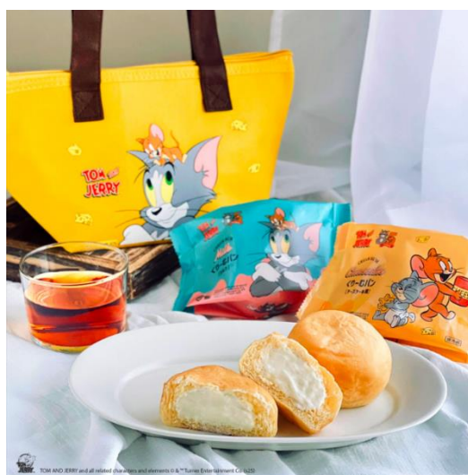
「トムとジェリーコラボ：くりむパン2個入り保冷バッグセット」(イメージ)

ミルクのパッケージと同じ「トムとジェリー」デザインで持ち歩きしたくなるようなかわいい保冷バッグです。