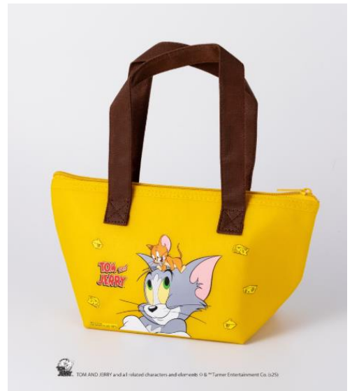
「保冷バッグ」 （イメージ）