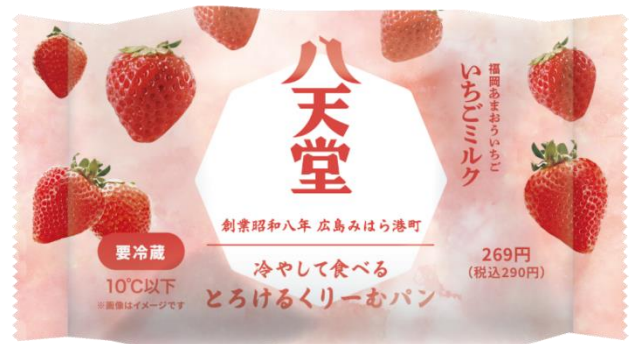
「パッケージ」（イメージ）