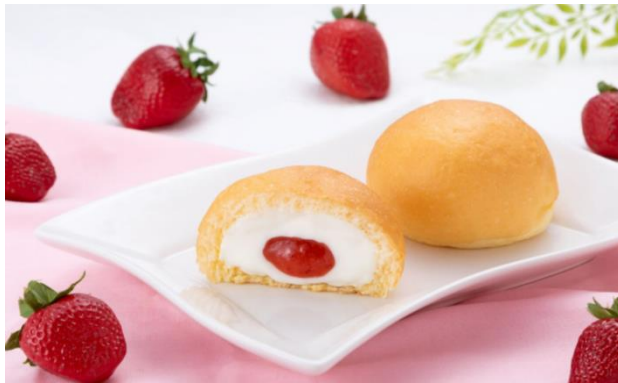
「冷やして食べる とろけるくりーむパン いちごミルク」（イメージ）

北海道産生乳と砂糖のみで作った練乳をミルククリームにし、みずみずしく甘酸っぱいあまおういちごのジャムと2層仕立てにすることで”いちごミルク”を表現しました。一口食べると練乳ミルククリームの優しい味わいと、ジューシーないちごジャムが広がる、まるで「食べるいちごミルク」のような味わいをお楽しみいただけます。見た目も可愛いいちご柄のパッケージが目印です。