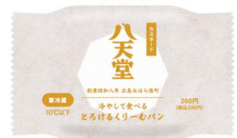
ファミリーマートオリジナルパッケージ カスタード（イメージ）

お客様の「もっと身近に」をテーマに、コンビニエンスストア・スーパー小売店限定販売品として、軽さとくちどけにこだわって開発した「冷やして食べる とろけるくりーむパン」シリーズをファミリーマートオリジナルパッケージで販売中。※一部店舗では取り扱いがない場合がございます。