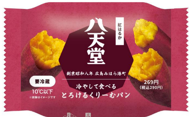
「パッケージ」(イメージ)