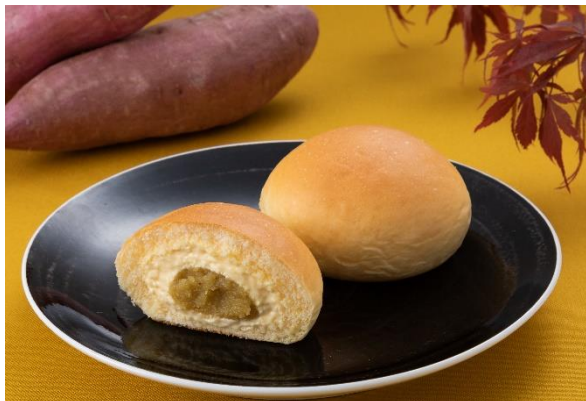
「冷やして食べる とろけるくりーむパン 紅はるか」(イメージ)

クリームはカスタードがベースのスイートポテト風味にリニューアルし、中心にはバニラの香りでスイーツ感がアップした紅はるかフィリングを2層仕立てで入れました。クリームの程よい甘みと、紅はるかフィリングのねっとりした食感でお芋感が楽しめる秋にぴったりのくりーむパンに仕上がりました。