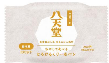
ファミリーマートオリジナルパッケージ カスタード(イメージ)

<お客様からのお問合せ> お客様相談室 TEL: 0120-52-7152 (平日 9:00-17:00)