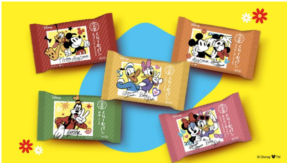
「ミッキー&フレンズ/くりーむパン 10個詰合せ（パッケージ）」（イメージ）

八天堂は「パン」と「スイーツ」が融合した「スイーツパン」で、お客様の笑顔・働くことで輝く人・より豊かな社会を創造・貢献することを目指します。