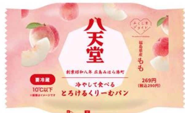
「パッケージ」（イメージ）