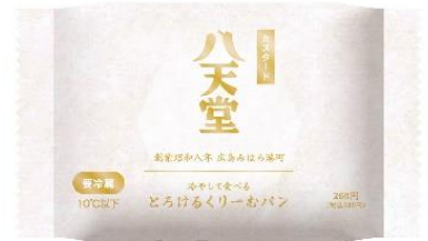
ファミリーマートオリジナルパッケージ カスタード（イメージ）