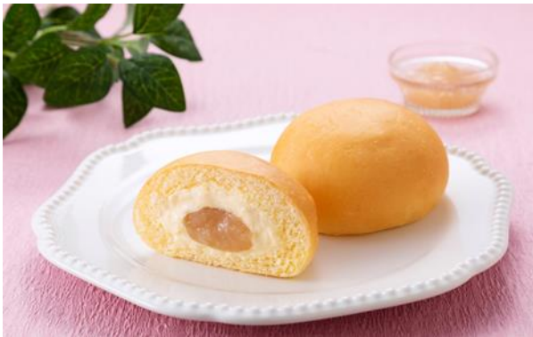
「冷やして食べる とろけるくりーむパン 福島県産もも」（イメージ）

桃の実をイメージしたグラデーションカラーに、「あかつき」をイメージしたイラストを組み合わせ、「ふくしまプライド。」（※1）の公式ロゴを掲載したパッケージが目印です。