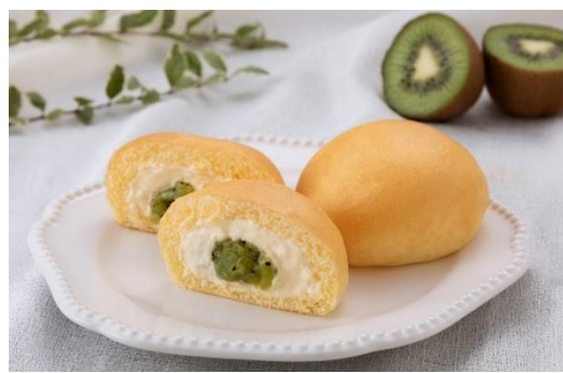
果実なくリーむパン ほらどキウイ（イメージ）