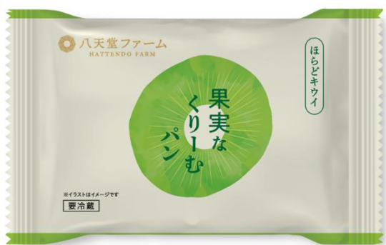
パッケージ（イメージ）

全国で推進されている農福連携の取り組みの認知拡大と、「農福連携」に2次産業、3次産業を組み合わせた「商工農福連携」を確立することで、付加価値と持続可能な利益循環構造の構築の一助となれるよう今後も努めてまいります。