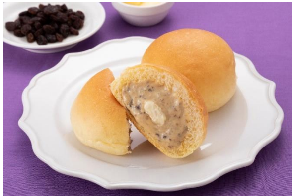
「とろけるくりーむパン ラムレーズンバター」 (イメージ)

八天堂は「パン」と「スイーツ」が融合した「スイーツパン」で、お客様の笑顔・働くことで輝く人・より豊かな社会を創造・貢献することを目指します。