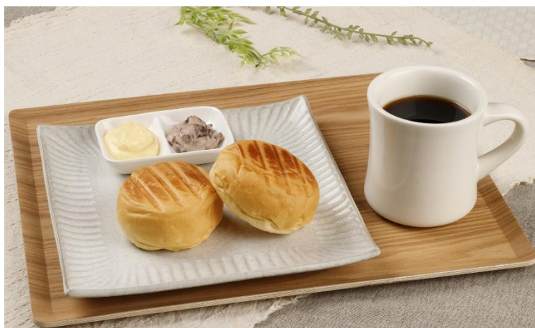
「モーニング 炭火焙煎たっぷりコーヒー・2種のクリーム」(イメージ)