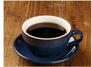
「炭火焙煎ブレンドコーヒー (HOT)」 (イメージ)

備長炭で珈琲豆をじっくり焙煎。クリーむパンとの相性を考えブレンドしたコクの中にあっさりした口あたりの香り高い炭火コーヒーです。