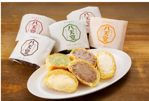
「クリーむパン」(イメージ)

「和菓子屋」として創業以来、「和洋菓子屋」「パン屋」と時代に応じて業態転換をしながらも、変わらないのは「甘いもので少しでも周りの人たちを元気づけたい」という想いです。和菓子・洋菓子・パンのジャンルが融合した新しいスイーツは10種類以上をショーケースで販売します。お手土産として購入のほか、店内でもお召し上がりいただけます。(店内でのお召し上がりの場合、税率は10%になります)