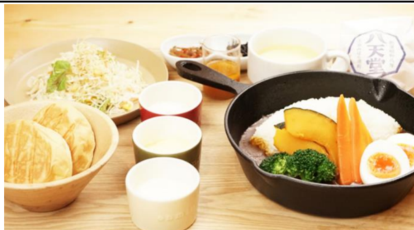
「ランチ 鉄板スパイシーカレー・パン選択」(イメージ)