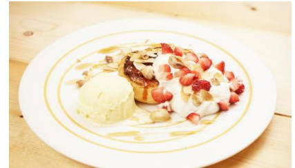
「フレンチトースト」(イメージ)

八天堂のクリーむパンを焼き上げた八天堂ならではのスイーツ。表面のカaramelをパリッと割ると中からクリームがトロッと溢れ出てきます。是非コーヒーと一緒に楽しみください。