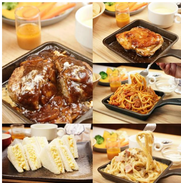
「ランチ 選べるメイン」(イメージ)