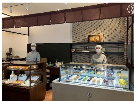
「八天堂がお届けする新たなスイーツコーナー」(イメージ)