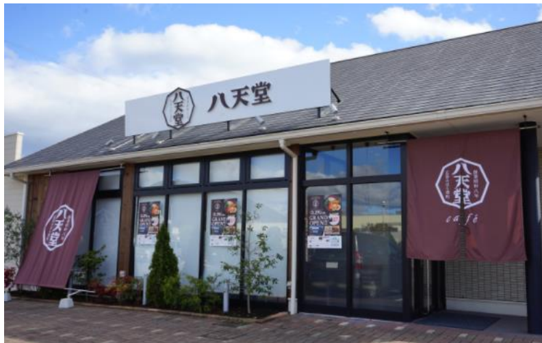
「八天堂 cafe 外観」

地元の皆様が、気軽にご利用いただけ、日常の中に溶け込むような集いの場となれるよう、社員スタッフ一同お客様をお迎えいたします。