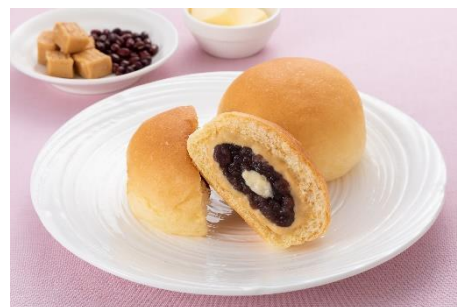
「とろけるくりーむパン 塩キャラメルあんバター」 (イメージ)

八天堂は「パン」と「スイーツ」が融合した「スイーツパン」で、お客様の笑顔・働くことで輝く人・より豊かな社会を創造・貢献することを目指します。