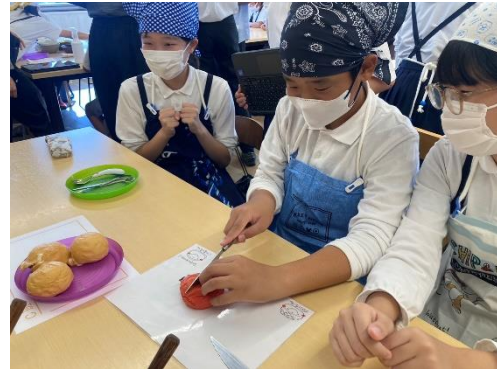
「試作・試食会の様子」