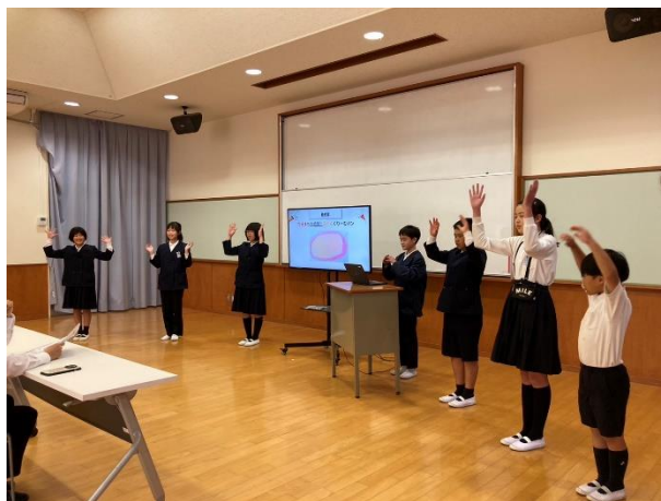
「プレゼン大会の様子」