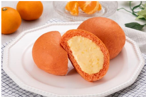
「みはらくりーむパン」(イメージ)

八天堂は「パン」と「スイーツ」が融合した「スイーツパン」で、お客様の笑顔・働くことで輝く人・より豊かな社会を創造・貢献することを目指します。