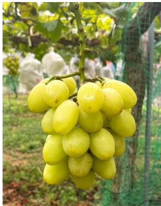
八天堂ぶどう園「天山」