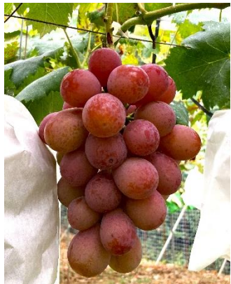
八天堂ぶどう園「クインニーナ」