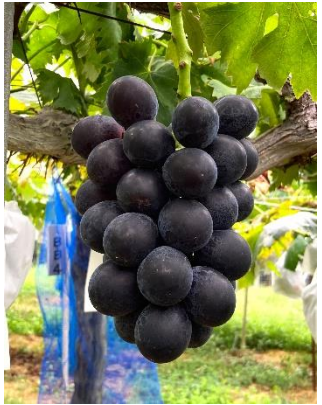
八天堂ぶどう園「ブラックビート」