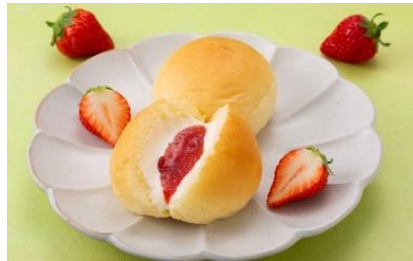
果実なくリーむパン いちご (イメージ)