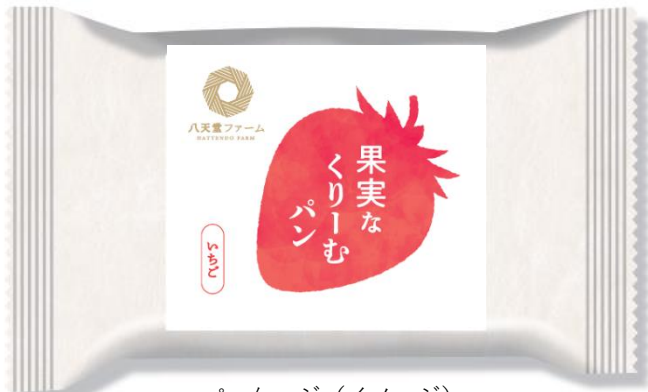
パッケージ (イメージ)

全国で推進されている農福連携の取り組みの認知拡大と、「農福連携」に2次産業、3次産業を組み合わせた「商工農福連携」を確立することで、付加価値と持続可能な利益循環構造の構築の一助となれるよう今後も努めてまいります。