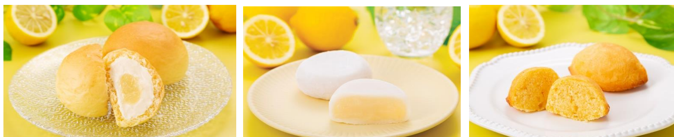
「左からくりむパン クリーム&レモンジュレ、とろける大福 レモン餡、レモンケーキ」(イメージ)

八天堂は「パン」と「スイーツ」が融合した「スイーツパン」で、お客様の笑顔・働くことで輝く人・より豊かな社会を創造・貢献することを目指します。